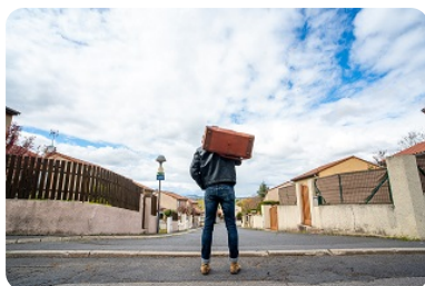
La Vie des Autres Cie La Joie errante Vendredi 7 novembre 20h30