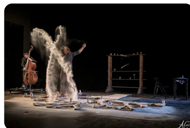
Évidences inconnues Cie Rode Boom Mardi 9 décembre 20h30