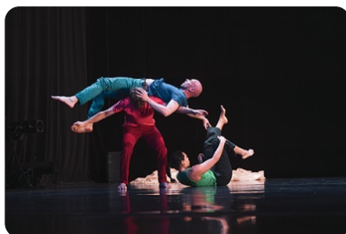
3 poids, 3 mesures Cie R.A.M.a Vendredi 28 novembre 20h30